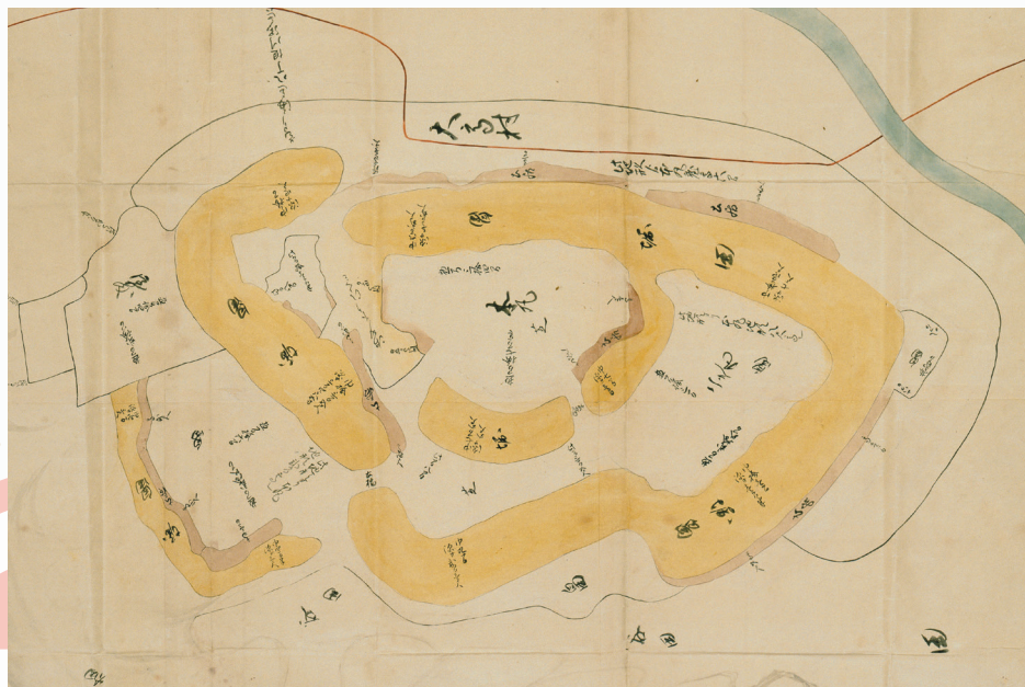
「知多郡大高村古城絵図」