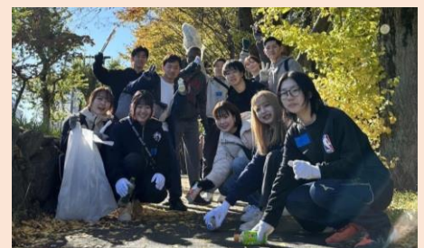
プロギングの様子