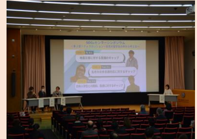
ディスカッションの様子