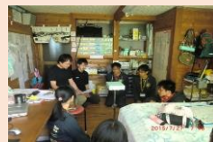
毎日午後8時から行う 症例検討会

さらに、診療所の周知や体調不良者の早期発見を目的として登山者に声掛け活動(予防的介入活動)も行います。