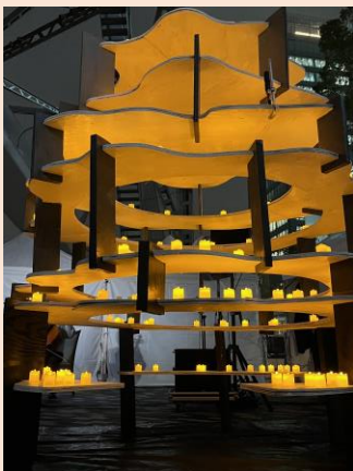
芸術工学部の学生による キャンドルアート

3月25日(月)、愛知県が主催する環境イベント「キャンドルナイトinあいち」に芸術工学部学生チームがキャンドルアート作品を出展しました。