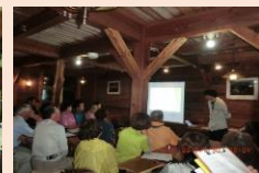
隔日の午後7時から行う 「雲上セミナー」