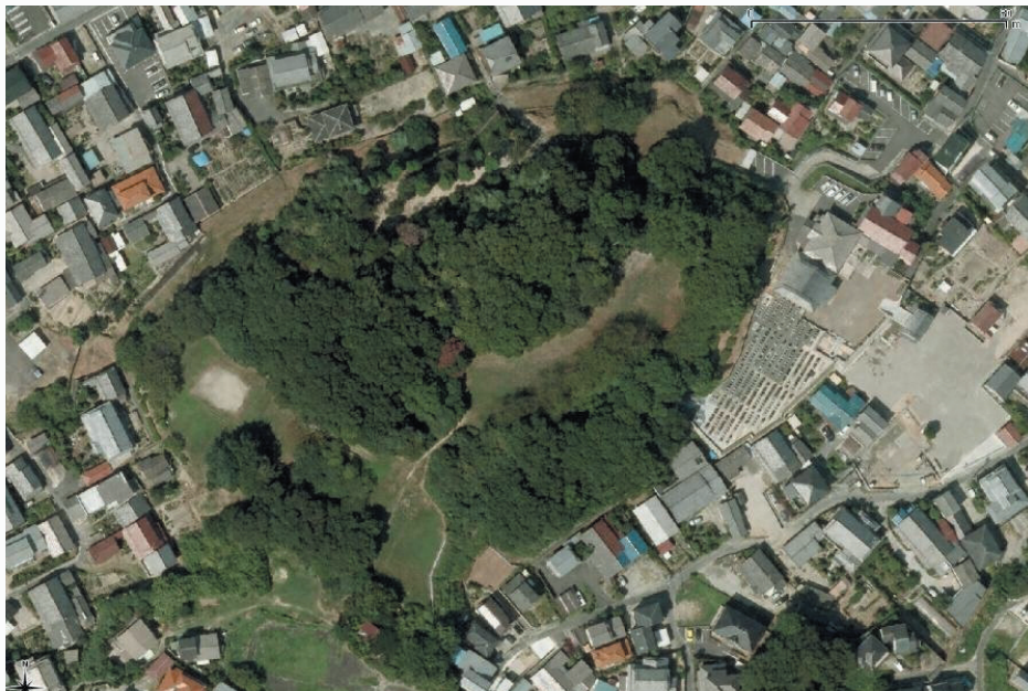
「大高城跡航空写真」